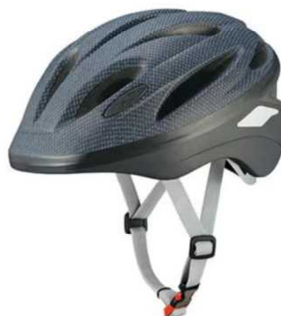
中学校では取り扱っていませんがこのようなタイプでも大丈夫です(このタイプは各自でご購入下さい)

※当日の欠席連絡を含め、本件に関わる問い合わせは、鶴山中学校教頭または事務室(電話 22-8231)までご連絡ください。