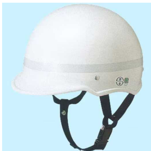
中学校が扱うヘルメットはこのタイプです 前部に校章シールが付きま