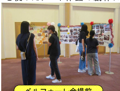
ベルフォーレ会場前

アート&クラフツ部は、中文連交流会で日頃の作品を展示したり、他校の生徒と共にパンダナを使ったアート作品の創作に挑戦しました。