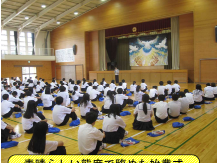
素晴らしい態度で臨めた始業式

8月27日、まだまだ暑さの残る中、始業式が行われ、令和6年度の2学期がスタートしました。この夏は、4年に一度のスポーツの祭典、オリンピックが開催されました。日本人選手の活躍もあり、大いに盛り上がりました。寝不足になった人も多いのではないのでしょうか。国内に目を向けると、暑さの激甚化や頻発するゲリラ豪雨などの異常気象、また地震も起こり、全国各地で被害が相次ぎました。そのような中、鶴山中では揃って2学期の始業式を迎えることができ、「あたりまえ」の尊さを改めて感じています。始業式後、初日から3年生は自己診断テスト、1, 2年生は課題テストでしたが、6時間、よく頑張りました!