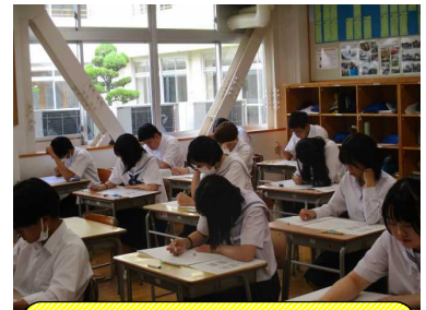
3年生 自己診断テストに挑む!

これからの社会の中では、単なる知識だけではなく、自分で考え、周りとの協力し、課題を解決したり、何かを創造していく力が求められます。私たち教員は、そのことを意識しながら生徒自身が自分たちの手で創り上げる行事にしたいと思っています。生徒が主人公となる学校づくりをめざします。