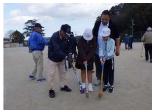
グラウンドゴルフ(4年生)