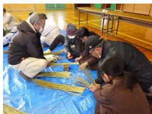
お正月お飾り作り(5年生)