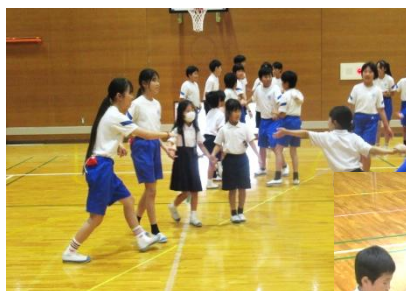
ゲーム 「もうじゅうがり」