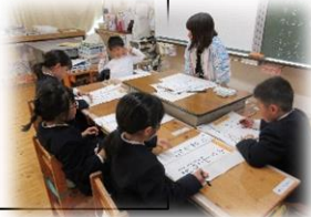
ゆっくり大きく書きました