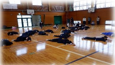
だるまさんが転んだや間違い探し