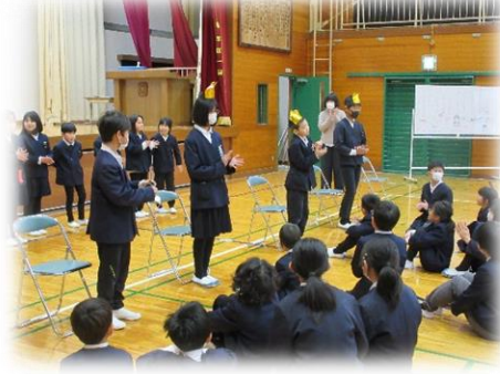
2・3年が企画した王様じゃんけん