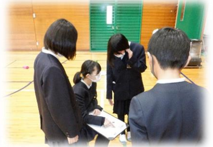
6年生お元気で！中学生になっても、喬松小のことを忘れないでください。