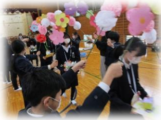
6年生の退場の時にたくさんの紙吹雪が舞いました。

いつも真面目に頑張る、優しい6年生は、みんなのあこがれです。いろいろな場面で最高学年として、みんなのお手本になってくれた6年生がもうすぐ卒業です。感謝の気持ちを込めて三月五日に、四・五年生が企画・運営して6年生を送る会を行いました。6年生にインタビューをしたり、下学年から感謝のプレゼントを渡したり、一緒にゲームをしたりして楽しい時間を過ごしました。卒業式は三月十九日(水)です。