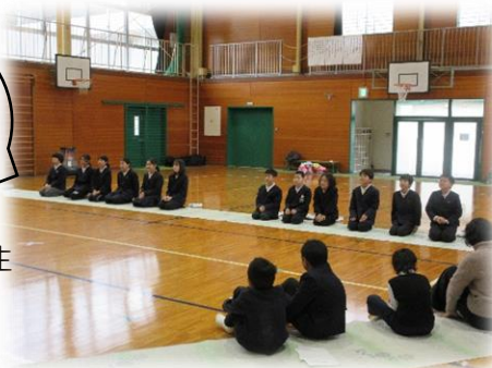
4・5年生の「6年生口説き」最高でした。