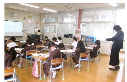
久永先生による授業観察