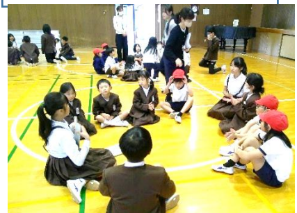
笑顔いっぱいの縦割り班活動。

自分の苦手なことや初めてのことにも勇気を出してチャレンジする姿やがんばっている友達を応援する姿がたくさん見られる1年間になることを願っています。おうちでもチャレンジしている姿を見たら「すてき!」とすかさずほめてあげてくださいね。