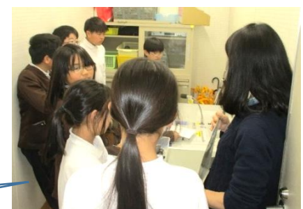
機材の使い方、アナウンスを練習する放送委員会。