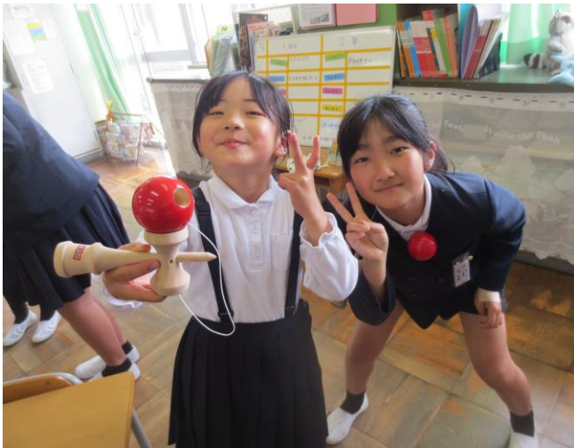
5/8 なかよしタイム～けん玉～