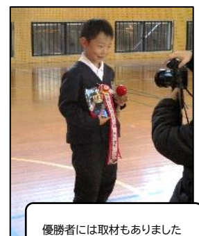
優勝者には取材もありました