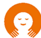
家庭教育支援チーム

ホームページ： https://www.city.tsuyama.lg.jp/life/index2.php?id=10051