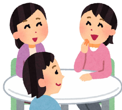
マスコット POKAちゃん

お子さんと一緒に参加してもOKです。絵本の読み聞かせや、折り紙などしながら、一緒にゆっくりした時間を過ごしませんか？