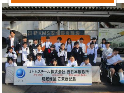
5年生 11/28(金) 製鉄所