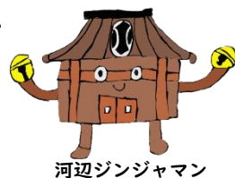
河辺ジンジャマン