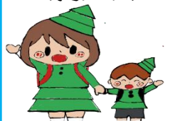
ヒマラヤちゃんと シーダくん