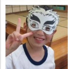
ノーマン先生が楽しいお面の型紙をたくさん作ってくれました！