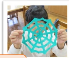
3年生 くものすのきり紙