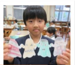
2年生 て 手つなぎおばけのきり紙