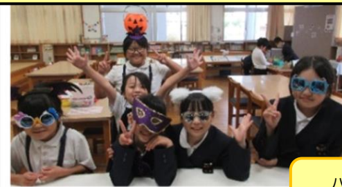
ハッピーハロウィン！