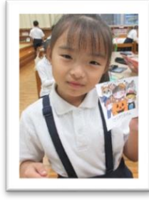
サイコロをふって、1さつプラス券をゲット！