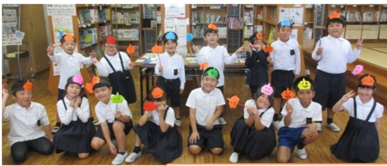
1年生 どくしよりよく 読書力がアップする魔法のステッキとかぼちゃのおめん