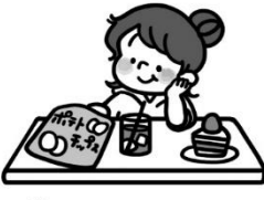
好きなものばかり食べている子