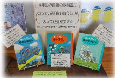
4年生が国語で学習した「白いぼうし」の載っている本