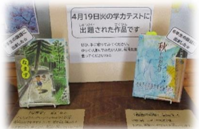
4月19日の学力テストに出題された本

児童玄関に机をひとつ置いて、小さな「本の紹介コーナー」を作ったら、たくさんの人が立ち止まって見てくれています。うれしいです。気になる本があれば、ぜひ図書室へ。