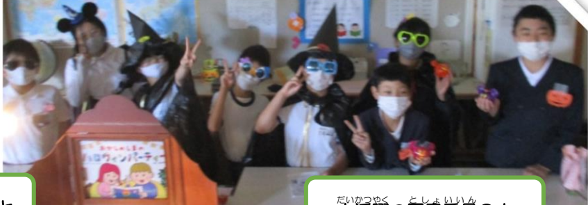
たいかつやく としよいいん 大活躍の図書委員8人