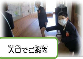
いりぐち 入口でご案内