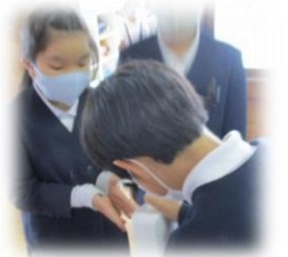
しょうどく 消毒・換気をしっかりと