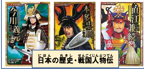
にほん 日本 れきし 歴史 せんごくじんぶつでん 戦国人物伝