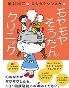
モヤモヤそうだん 心のなかがザワザワしたら、1日1回就寝前におのみください。