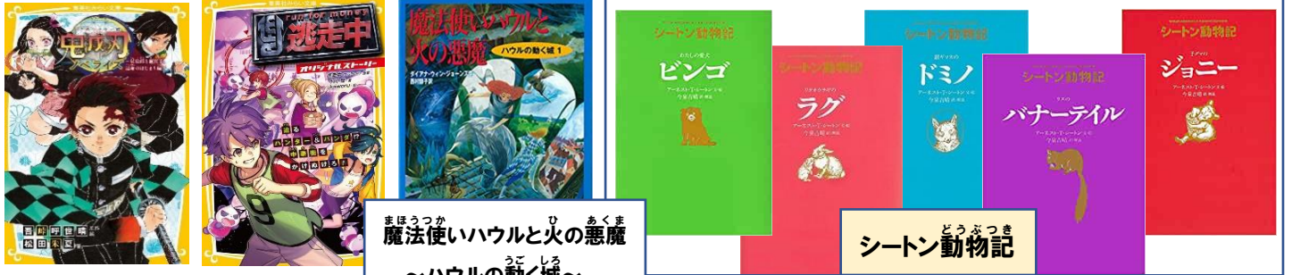
まほうつか 魔法使いハウルと火の悪魔 ああくま 悪魔 うごくる 動く ～ハウルの動く城～