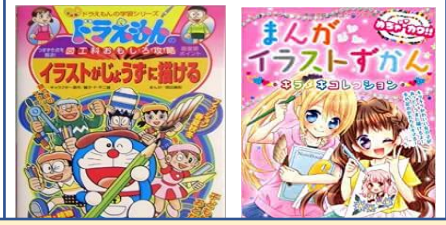
「イラストがじょうずになる本がほしい」というリクエストにこたえました!