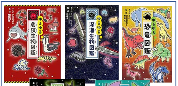
ゆるゆる図鑑 ☆自学につかっている人もいます☆