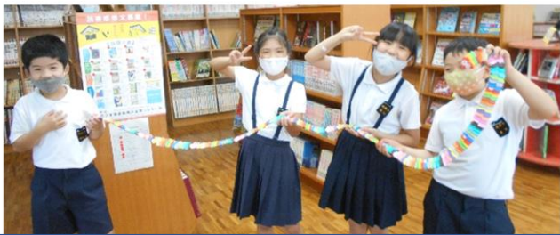
ジーズGsくんの作り方は3年生のさんが教えてくれました。