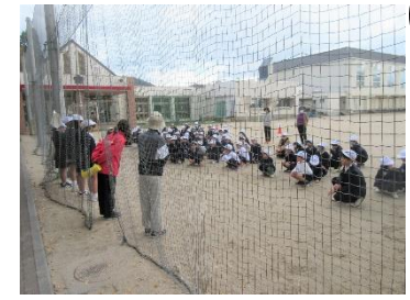
人権の花植え 「花いっぱい運動」