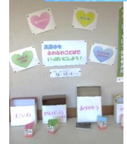
人権週間の取組 「高田小をふわふわことば」 でいっぱいしよう