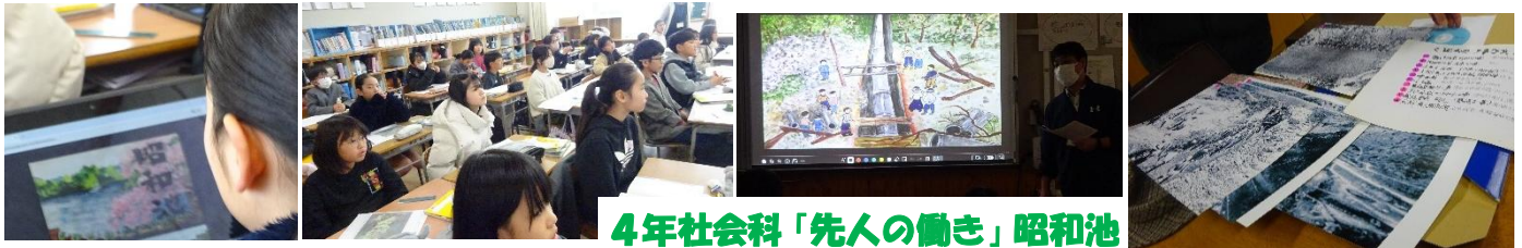
4年社会科「先人の働き」昭和池

4年生は社会科で、田んぼに水を引くために人力で築かれた「昭和池」の歴史を学びました。地域の方からいただいた手作り紙芝居や貴重な資料のおかげで、先人の苦労と協力の精神を肌で感じる事ができました。