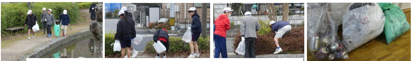
6年家庭科「ともに生きる地域での生活」下河原公園清掃

4年生は社会科で、田んぼに水を引くために人力で築かれた「昭和池」の歴史を学びました。地域の方からいただいた手作り紙芝居や貴重な資料のおかげで、先人の苦労と協力の精神を肌で感じる事ができました。