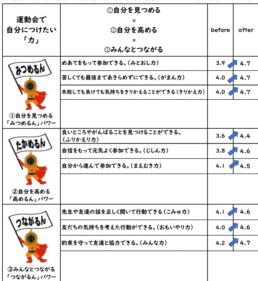
令和6年度 向陽小学校 運動会 児童アンケート結果

5点(よくてきた)、4点(できた)、3点(まあまあできた)、2点(あまりできなかった)、1点(できなかった)