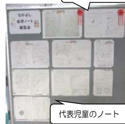
代表児童のノート

2学期の自学ノート展覧会は、自分のクラスの自学ノートを見合うだけでなく、1年生は2年生の自学ノートを、2年生は3年生の...というように上の学年の自学ノートを見学しました。6年生は1年生のノートを見ました。先輩学年のノートのすばらしさを発見するとともに、6年生は1年生にやさしいはげましのメッセージを送っていました。教室前廊下や児童玄関に、代表ノートを掲示しています。3学期も引き続き取り組みます。保護者の皆様には、声かけやコメントのご協力をよろしくお願いいたします。