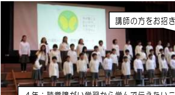
講師の方をお招きして