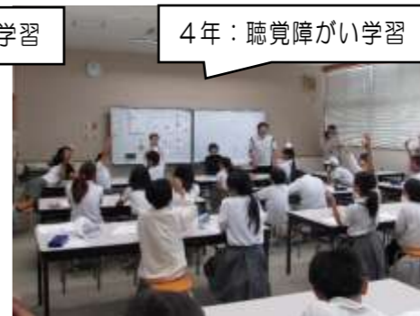
4年：聴覚障がい学習