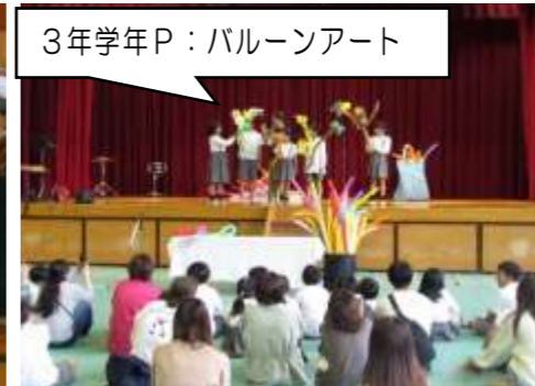
3年学年P：バルーンアート