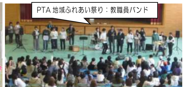
PTA 地域ふれあい祭り：教職員バンド