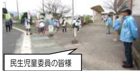
民生児童委員の皆様