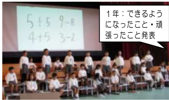
1年:できるようになったこと・頑張ったこと発表