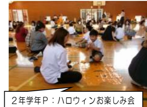
2年学年P：ハロウィンお楽しみ会