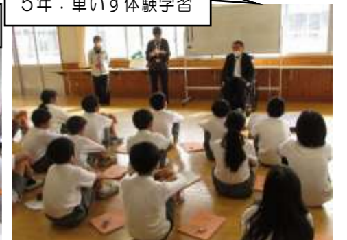
5年：車いす体験学習

社会福祉協議会の方と、視覚障がいの方（3年）、聴覚障がいの方（4年）、車イスの方（5年）に来ていただき、バリアフリーやユニバーサルデザインについて学習しました。各学年でアイマスク体験、手話学習、車イス体験を行い、障がいを助ける道具、実際の生活の様子や願いなどについてお話を聞きました。