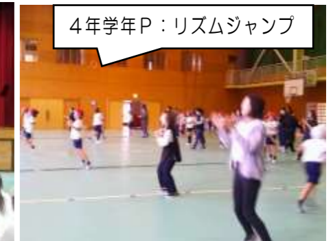
4年学年P：リズムジャンプ