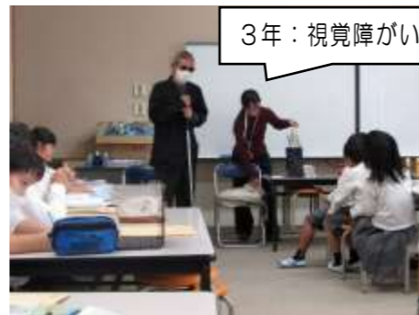
3年：視覚障がい学習