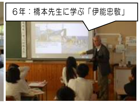
6年：橋本先生に学ぶ「伊能忠敬」