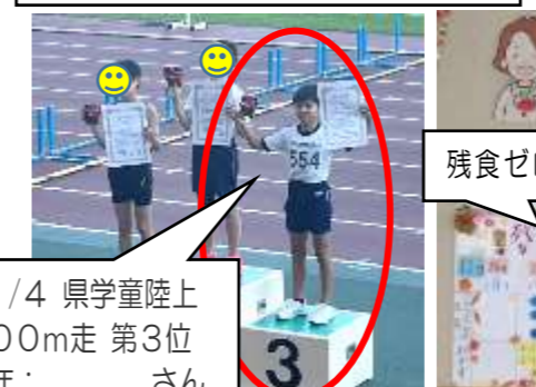
11/4 県学童陸上100m走 第3位 5年： さん