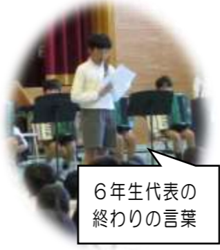
6年生代表の終わりの言葉