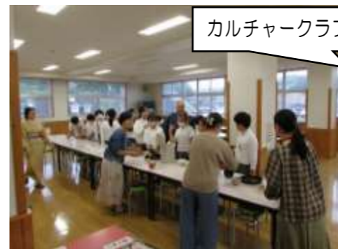
カルチャークラブ：茶道体験、絵手紙