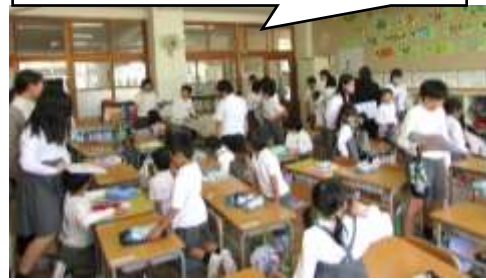
6年生が1年生教室まで迎えに

1年生～6年生までのなかよし班(1組は赤色と黄色、2組は白色と青色)、各色6班の約10人の縦割りグループの顔合わせ会を行いました。6年生が1年生教室まで送り迎えしてくれてとても心強かったです。それぞれの班で自己紹介、「ハンカチ落とし」や「だるまさんがころんだ」などの遊び、さいごにふりかえりをして楽しみました。6年生がリーダーとして大活躍でした。