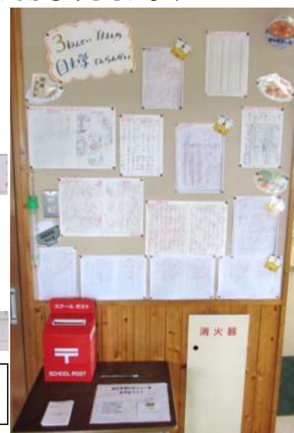
3年生の自主学習から