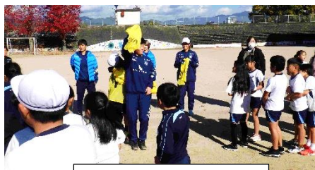
4・5年生サッカー教室

4・5年生が「アスリート派遣事業」の一環で岡山湯郷 belle の選手とコーチ5名の方を迎えてサッカーの楽しみ方を学びました。どの学習も子どもたちにとって新鮮で、動作と思考が繰り返され、楽しく学んでいくことができたようです。本当に貴重な体験がたくさんできたことに、関係者の皆様に改めて御礼申し上げます。ありがとうございました。