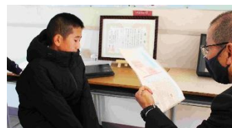
ミッションにチャレンジ中！

18日(木)2、3校時目に、スタンプラリーを全校で実施しました。インフルエンザのため1週間先延ばしをしましたが、その分準備がしっかりできました。15チームに分かれた1~4年生たちが、5、6年生が用意した様々なゲームやクイズ、アトラクションにチャレンジしていきましました。チームリーダーの4年生が下級生たちを引き連れ、協力して課題をクリアする姿に頼もしさを感じ、また5、6年生たちが後輩たちを優しく受け止める姿が印象的でした。